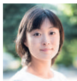
安田菜津紀 認定NPO法人 Dialogue for People フォトジャーナリスト