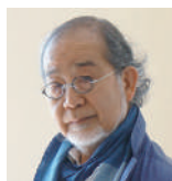
鎌田 實 医師・作家