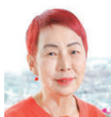
上野千鶴子 社会学者 東京大学名誉教授