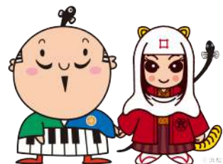
出世大名 家康くん 出世法師 直虎ちゃん